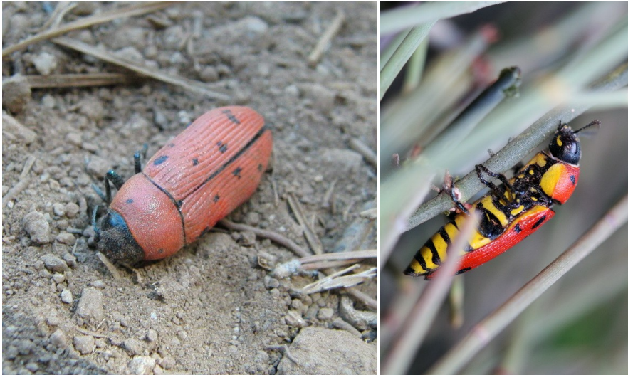
Figuras 1 - 2. Buprestis sanguinea en la provincia de Málaga; 1. individuo hembra encontrado muerto el 28.VII.2017; 2. segundo ejemplar hembra encontrado vivo el 30.VII.2017.

El pasado 28 de julio de 2017 fue recogido, ya muerto, un ejemplar hembra de la especie (Sussane Vogel lgt., Klaas Ruißmann col.) en un monte de la población de Alhaurín de la Torre, a una altitud aproximada de 600 m. Informados de la captura, el primer autor de esta nota acude al lugar el día 30 de julio de 2017 para intentar conseguir algún nuevo ejemplar y asignar la población a alguna de las subespecies descritas de la Península Ibérica. Afortunadamente se pudo conseguir la captura de una nueva hembra que nos ha permitido identificarla como perteneciente, con alta probabilidad, a la ssp. calpetana , ya mencionada. No obstante es preciso poder estudiar machos de esta población para una asignación definitiva a dicha subespecie.